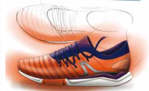
RW900, nouvelle version