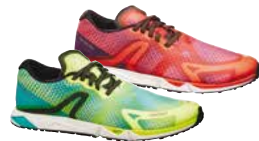
RW900, version originale

Dès sa sortie, la RW900 est plébiscitée pour sa légèreté, sa souplesse et son dynamisme par de nombreux marcheurs athlétiques. Elle attire les marcheurs les plus performants et exigeants d'entre eux tel que le champion Yohann Diniz qui a testé et approuvé les RW900 en compétition dès leur sortie.