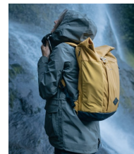
SAC À DOS EXPLORE ROLLTOP NH500 - 40€