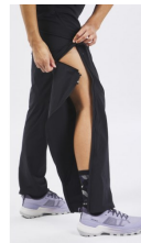
PANTALON MODULABLE MH550 - 45€