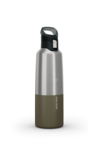
GOURDE ISOTHERME INOX 1L MH500 - 18€