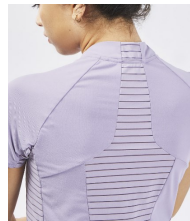
T-SHIRT RESPIRANT MH500 - 15€