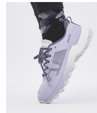
CHAUSSURES DE RANDONNÉE MH500 LIGHT - 75€