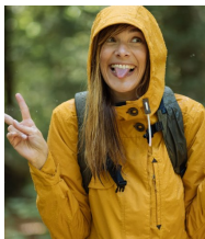
VESTE DE RANDONNÉE NH550 - 50€