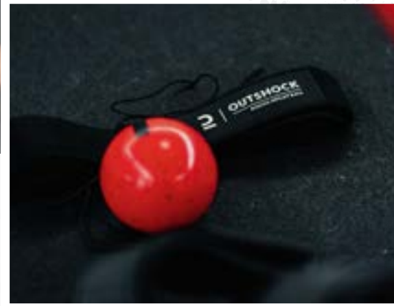
RÉFÉRENCE 8651243 - 10€ LE KIT